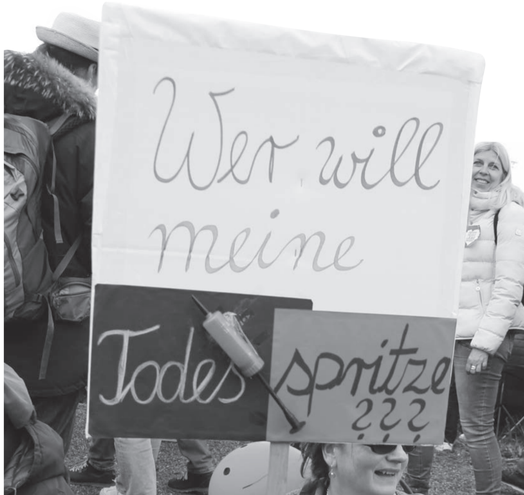
Demokratin in Stuttgart warnt vor Nebenwirkungen.

Europaweit wurden nunmehr insgesamt 133.310 Nebenwirkungen im Zusammenhang mit der Astrazeneca-Impfung